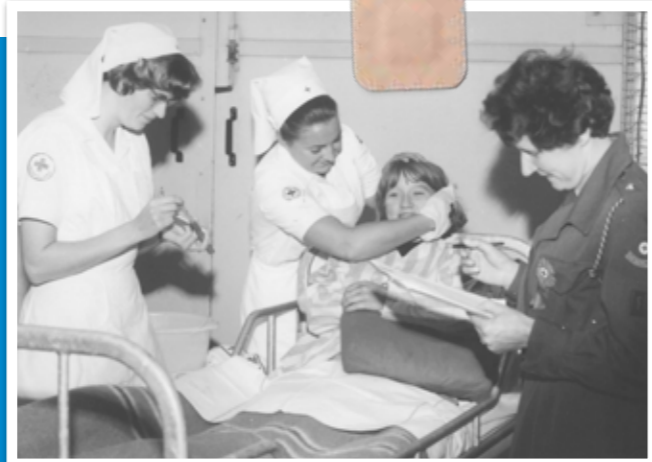
Prinses Margriet tijdens de afsluiting van haar opleiding tot Helpster in Amersfoort, 1966

"24 jaar was ik. Net als andere meisjesstudenten had ik tijdens mijn studie regelmatig met veel plezier in het ziekenhuis in Leiden geholpen. De keuze hoe ik mijn vrijwilligersperiode, een zogeheten diaconaal jaar, ging invullen, was